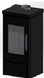
Interiérová kapotáž pre VERNER IK 13/10.2 PP a VERNER IK 13/10.2 PZ