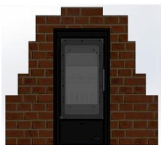
„Zazdivací“ kapotáž pre VERNER IK 13/10.2 PP