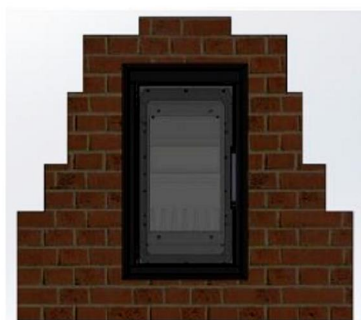
„Zazdivací“ kapotáž pre VERNER IK 13/10.2 PZ